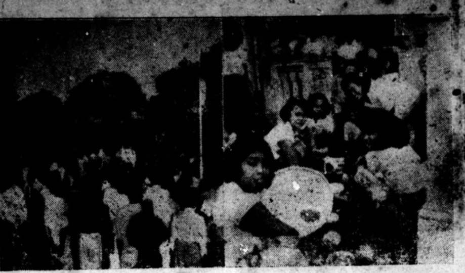
Hari Penjabutan Kedaulatan di Bangkok yang diselenggarakan oleh Perwakilan Rep. baru ini. Kiri: "Upatjara menaikkan Dwi warna." Kanan: Pemandangan dalam dapur Perwakilan tersebut.